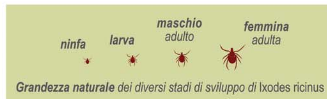
Grandezza naturale dei diversi stadi di sviluppo di Ixodes ricinus